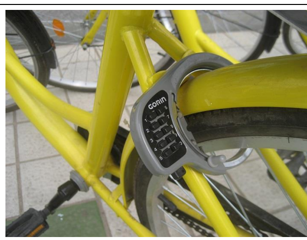
自転車のカギ、解錠のキーはスマホで