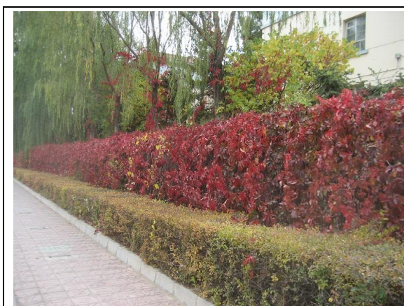
キャンパスの蔦 (名前は?)

キャンパスの樹木は次々と葉を落とし始めました。掃除のおばさんたちが掃いても掃いても、道路は落ち葉で黄色く染まります。そういえば10月27日は朝から雪が降り始め、初冠雪となりました。ただ、蘭州は日射しが強いので、積もった雪はあっという間に融けてゆきます。キャンパスの木々は来週辺りにはすっかり葉を落とし、冬の装いに変わっていることでしょう。