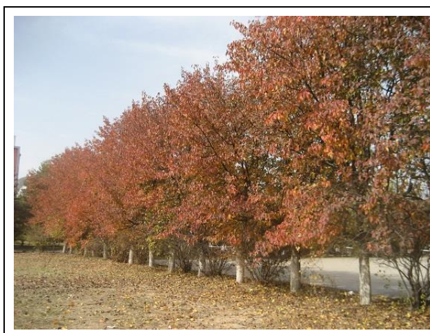
バドミントンコートの梨

こう見ると、学生たちの生活にとって、スマホはなくてはならないものになっています。場合によっては日本の学生より、利用率、あるいは、依存率が高いかもしれません。キャンパスはりっぱなスマホ社会です。