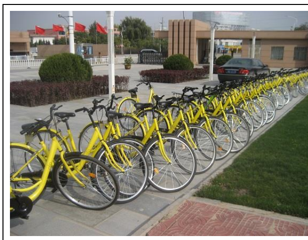
キャンパス自転車

この仕組みはみんなで食事をして、割り勘にする時に便利です。食事が終わったあと代表者がスマホで店へ支払います。次に参加者が割り勘の料金を代表者のサイトへ入力して終わりです。これまで割り勘を支払う時は、小銭が無いといちいち相手にお釣りを支払うのが面倒でした。また、20.3元とか24.5元といった端数が出るとこれもたいへんでした。今ではスマホで相手のサイトへ数字を入力するだけで終わります。みんなで食事をして現金で払うのはいよいよ私だけになりました。