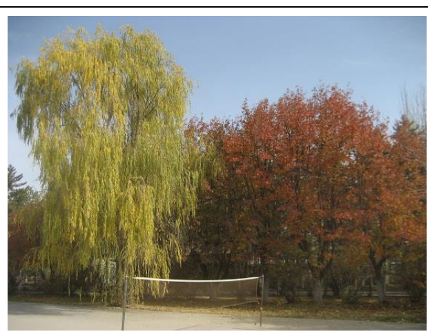
バドミントンコートの柳と梨