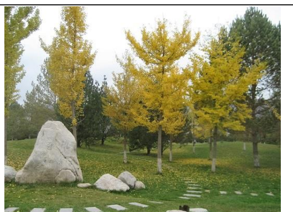
恋人公園のポプラ?